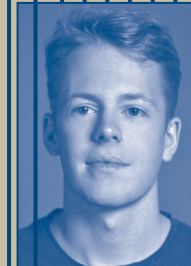
VIDEO Marty / Trezzini