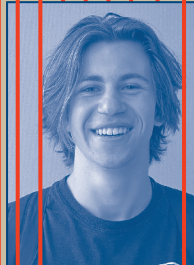
MUSIKALISCHE ARRANGEMENTS James Pitts