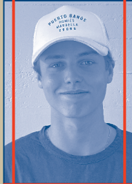
MITARBEIT BÜHNE, LICHT & TON Ben Stüdi