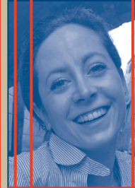
KOSTÜM / MASKE, REQUISITEN & GESAMTORGANISATION Alexandra Frick