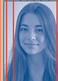
MITARBEIT KOSTÜM / MASKE Alexa Hillebrand