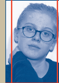
MITARBEIT KOSTÜM / MASKE / COACHING PROBEN & REGIEASSISTENZ Zoe Morgenroth