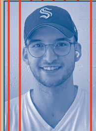
MITARBEIT BÜHNE, LICHT & TON Henri Dietz

Inspektor, Russel, Blumenverkäufer, Prinz Ludwig von Ungarn