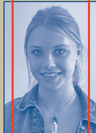
MITARBEIT KOSTÜM / MASKE Alina Bergner