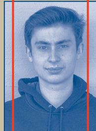
MITARBEIT BÜHNE, LICHT & TON Roger Huber