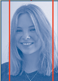
MITARBEIT KOSTÜM / MASKE Claire Ballinger