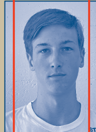
MITARBEIT BÜHNE, LICHT & TON Luka Hajdin