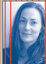
GESTALTUNG PLAKAT / FLYER / PROGRAMM Vanessa Wolf