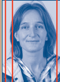
BÜHNENBILD Claudia Toluoso