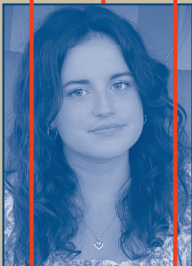
MITARBEIT KOSTÜM / MASKE Jana Raif