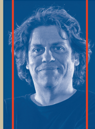
LICHTKONZEPT Markus Brunn