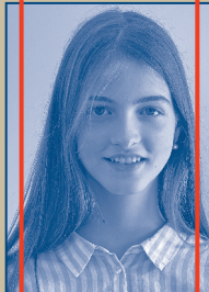
MITARBEIT KOSTÜM / MASKE Mila Beer