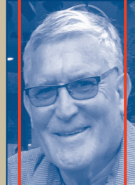
BÜHNENBAUTEN Peter Gasser