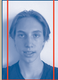
MITARBEIT BÜHNE, LICHT & TON Tristan Tröndle